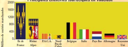
Principales clientèles touristiques en Vaucluse

Profil du touriste vaclusien : français âge moyen 44 ans, aux revenus aisés, séjournant dans le département en couple avec un enfant pour les loisirs-vacances. Pratique des loisirs de plein air (balades, vélo) à la découverte de l'Art de Vivre en Provence.